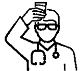
Ανάλυση στο διαγνωστικό κέντρο Μικροδιαγνωστική