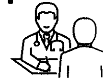
Επίσκεψη στο ιατρείο